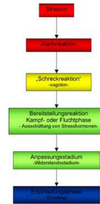
Abb. 3.: Stress-Reaktion nach Seyle

Hypothalamus-Hypophysen-Nebennierenrinden-Achse (HHNA) Kommunikation zwischen: Hypothalamus, Hypophyse und Nebennierenrinde, Ausschüttung von Corticosteroiden (ACTH), längerfristige Anpassungsreaktion (Abb. 4)