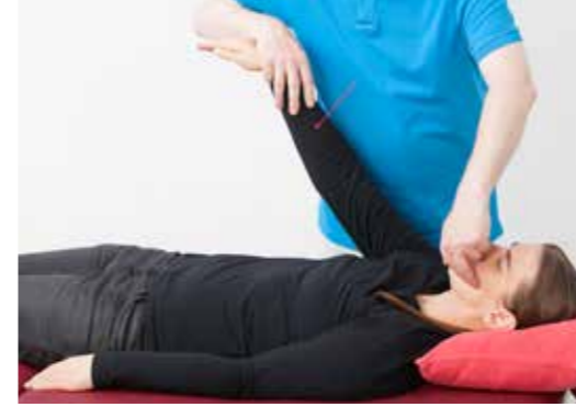
Abb. 2: Der Muskeltest

2) Den Muskel herausfordern (engl.: challenge) Dann setzen wir einen Reiz: Wir können z. B. unseren Patienten bitten, eine „verdächtige“ Narbe zu berühren oder Druck auf eine Nasennebenhöhle auszuüben. Wir können ihn auch bitten, an seine Angst oder Wut zu denken, und damit diese Empfindungen im Körper aktivieren. Ebenso können wir uns von unserem Patienten verschiedene Substanzen (Nahrungsmittel, Kosmetika etc.) mitbringen lassen, von denen er vermutet, dass er darauf reagiert, und die „Muskelantwort“ auf die Substanzen prüfen. Auch körperliche Blockaden lassen sich „herausfordern“: Wenn wir z. B. einen blockierten Wirbel berühren, schaltet der Testmuskel mit hoher Wahrscheinlichkeit ab.