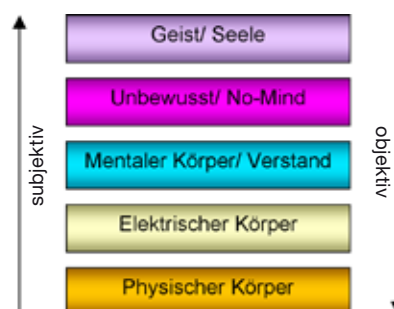
Abb. 5: Heilungs- und Bewusstseins Ebenen des Körpers

Erkenntnisorientierung Die Kinesiologie beinhaltet keine Medizin, die unterdrückt. Wir decken auf. Vorsichtig arbeiten wir uns im kinesiologischen Prozess zu den Ursachen und Auslösern einer „Krankheit“ bzw. Funktionsstörung vor. Wir betrachten die Ebenen, die mit Röntgenapparaten nicht durchleuchtet werden können und über die das Blut uns keine Auskunft gibt. Die eine Ursache gibt es meiner Erfahrung nach nicht. Insbesondere chronische Krankheiten zeigen fast immer eine multifaktorielle Genese, die auch alle Ebenen des Individuums mit einbezieht. Das hat zur Folge, dass der Muskeltest oftmals unbewusst und bisher „unter Verschluss gehaltene“ Stressreize ans Licht bringt. Ein Prozess, der für den einen oder anderen auch schmerzhaft sein kann. Werden die unbewussten Anteile integriert, geht der Patient gestärkt daraus hervor.